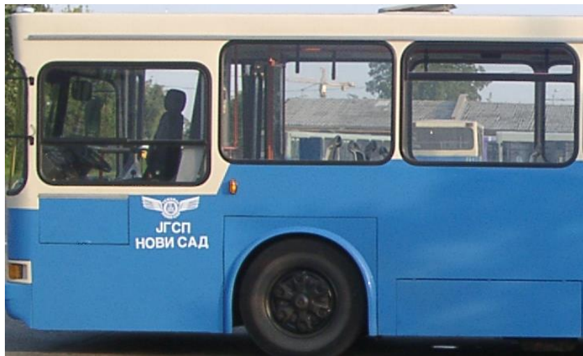
Сл. 3 Оквирни приказ захтеваног лакирања

Завршно лакирање извршиће се у договору са Наручиоцем, према скици фарбања која ће бити достављена понуђачу коме се додели уговор о јавној набавци. Прелиминарно, завршно лакирање доњег дела оплате потребно је извршити са лаком RAL-5015, а горњег дела са лаком RAL-1015 (граница горњег и доњег дела оплате је доња ивица бочних стакала, Слика 3).